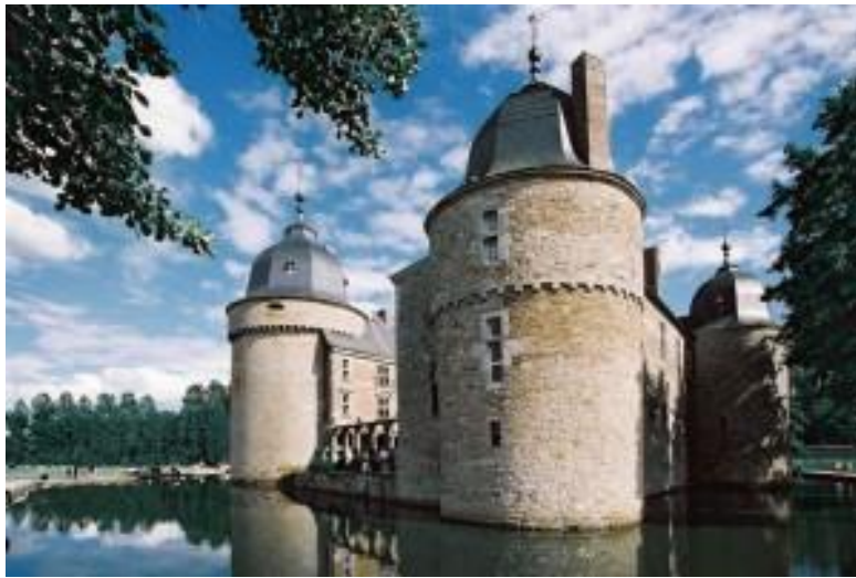
Château de Vêves